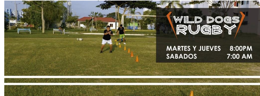
Portada Octubre 2018